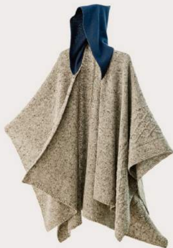
< tate >