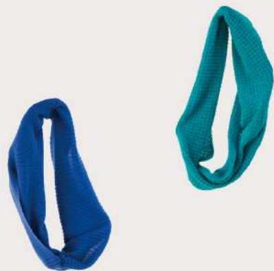
< tsutsu >