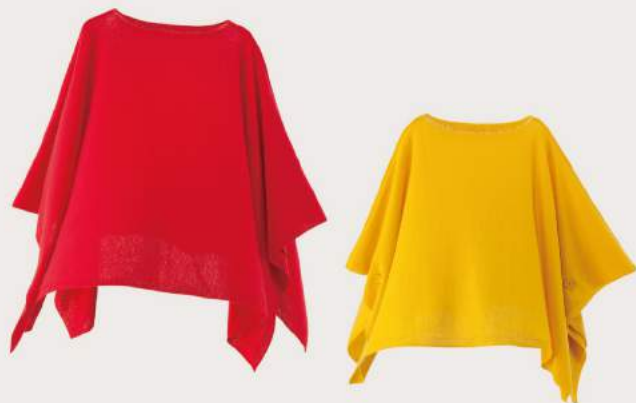
< yoko >