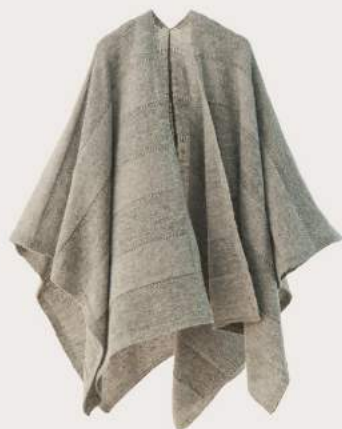
< tate >