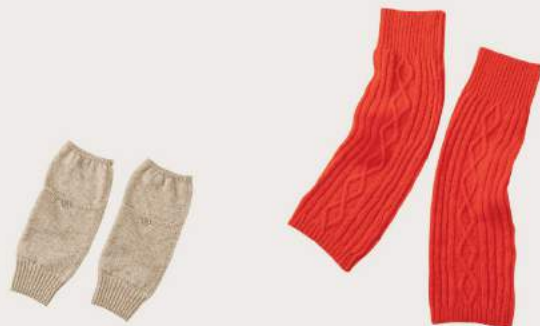
< kote >